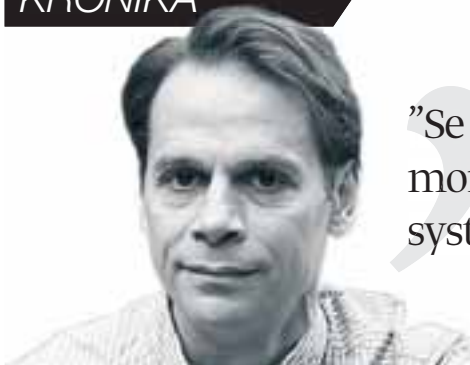
Lambros Andréasson Sidecore AB.

”Se över ”reseprocessen” och identifiera onödiga moment och tidstjuvar. Ersätt dessa med smarta system för bokning och administration av resor.”